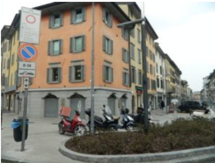
I marciapiedi diventano un parcheggio per le moto

Ora la via aspetta di veder inaugurare il polo culturale al civico 33 e di essere maggiormente coinvolta dal distretto del commercio: «È positivo che sin dal primo incontro, cui ho invitato a prendere parte tutti i commercianti della via ma cui ha partecipato solo un piccolo gruppo, si sia invocato un maggior coinvolgimento di tutti. Ho cercato più volte di sensibilizzare i commercianti stranieri senza ahimè esiti positivi. La speranza è che i tempi siano maturi se non per una vera e propria integrazione per un confronto, il cui punto di partenza deve essere però la condivisione di regole comuni e