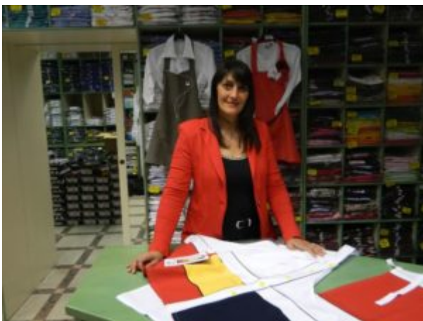
Da oltre vent'anni "La Giacca" , negozio specializzato nella vendita di