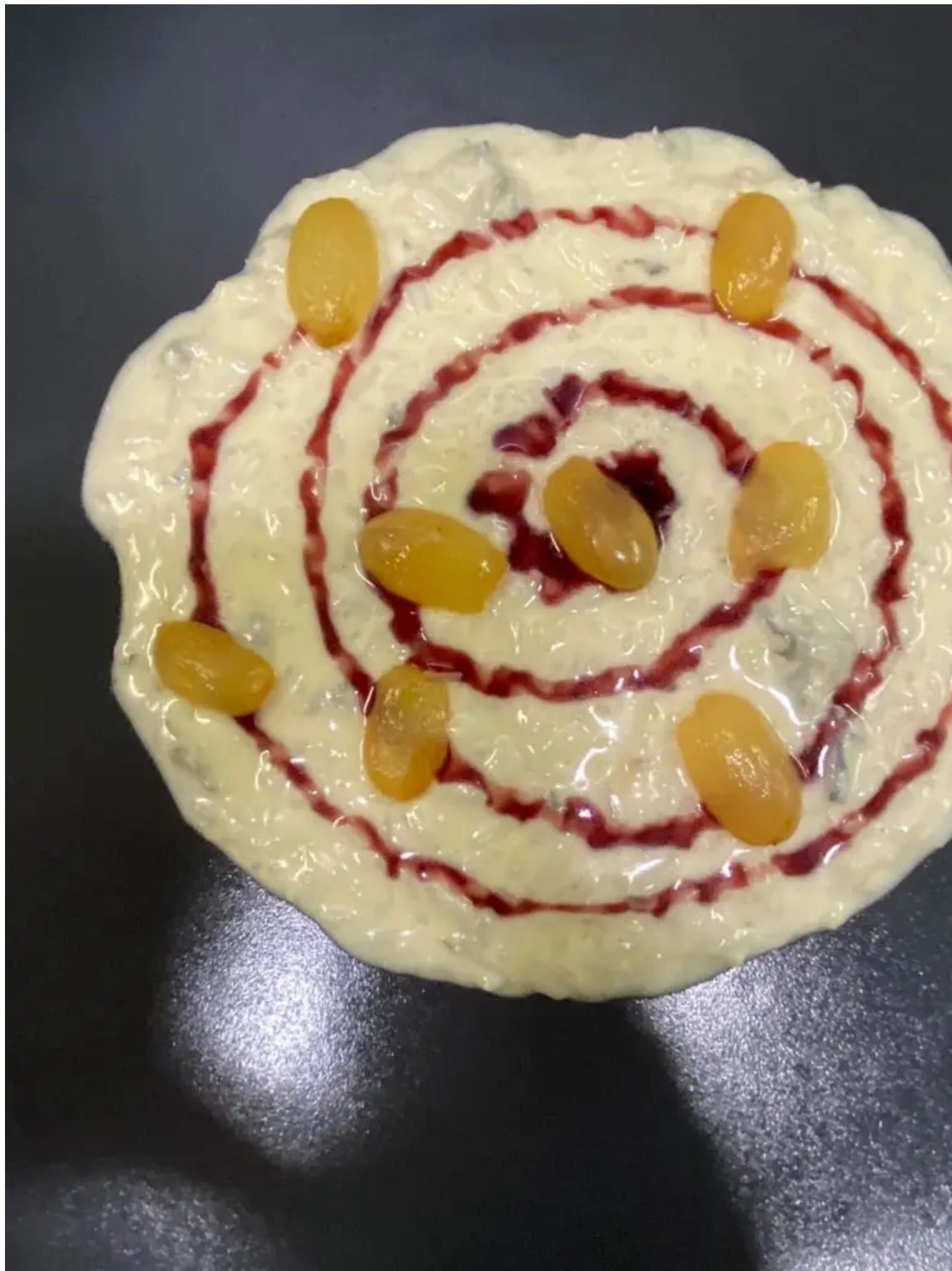
Risotto mantecato al Blu Rossini di Arrigoni Battista con Raisin e riduzione al Valcalepio rosso Riserva