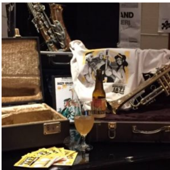
Best Western hotel Cappello d'Oro