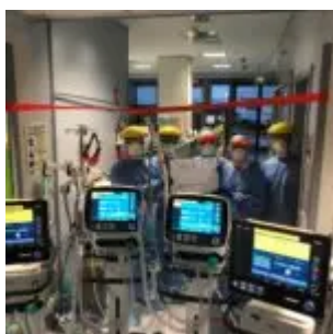
Ente Bilaterale del Terziario dona apparecchi per la ventilazione assistita all'Ospedale Papa Giovanni XXIII