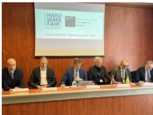
La presentazione di International Fair Trade Italy

prodotti, novità e trend del settore giardino e casalinghi dall'estremo Oriente. Bergamo sarà sede -oltre a Shangai in Cina e New Delhi in India- dell'International Fair Trade. China International Hardware Show a Shanghai e International Hardware Fair India a New Delhi rappresentano eventi di riferimento per il mercato nazionale con una partecipazione internazionale e garantiscono a espositori e visitatori nuove possibilità di business internazionali, riunendo in modo mirato domanda e offerta del settore. International