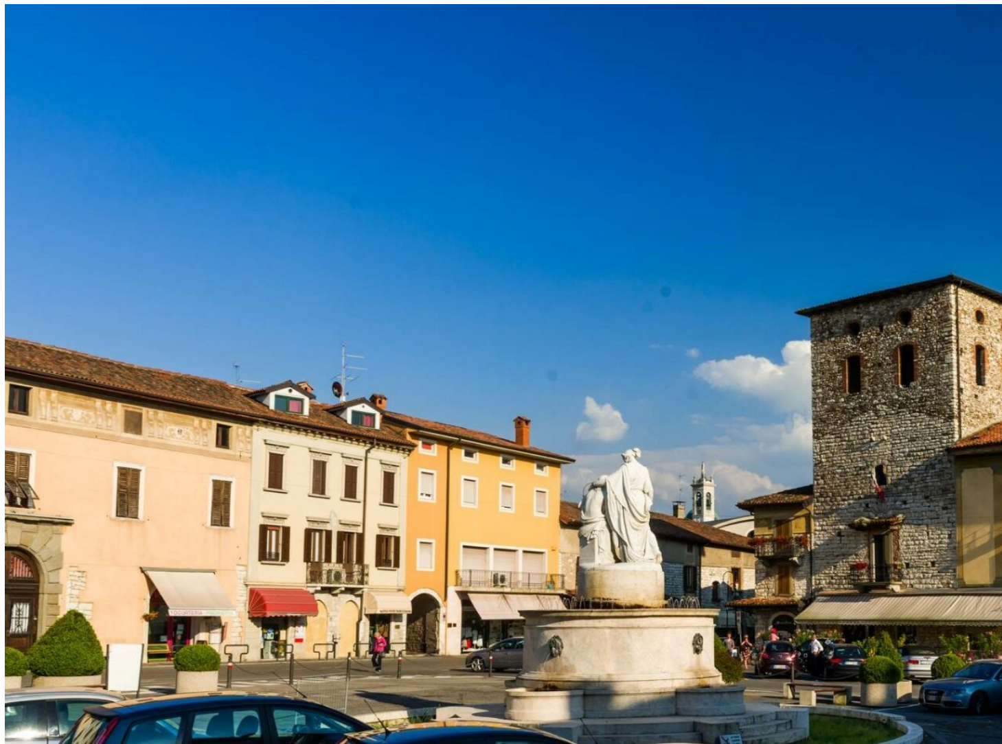
Trescore Balneario