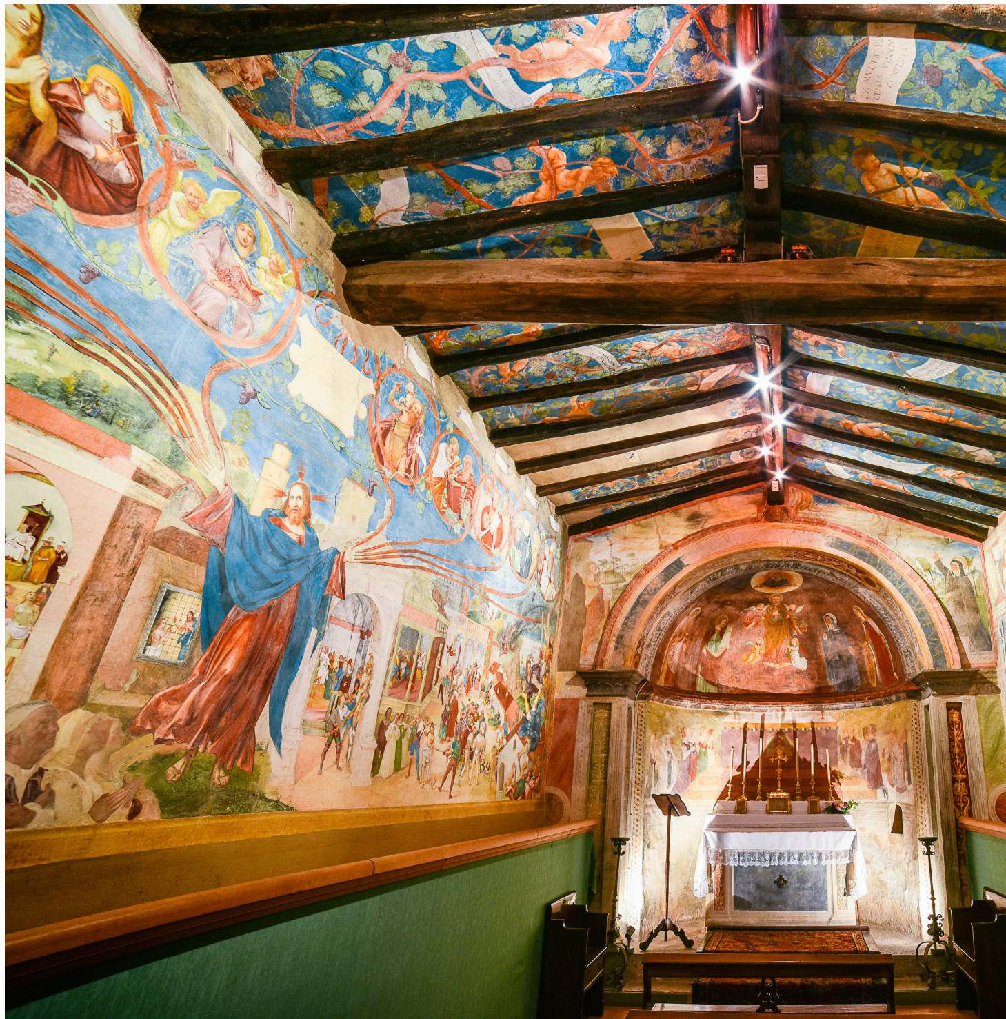
Oratorio Suardi